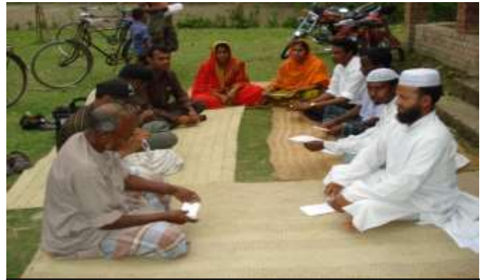
ওয়ার্ড নারী ও শিশু নির্যাতন প্রতিরোধ কমিটির ত্রৈ-মাসিক সভা।

ওয়ার্ড কমিটির সদস্যদেরকে নিয়মিত মিটিং এর মাধ্যমে নির্যাতন প্রতিরোধমূলক কার্যক্রমে তাদেরকে উৎসাহিত করা। বিগত কোয়ার্টারের পরিকল্পনা অনুযায়ী কাজের অগ্রগতি, বাধা/ঝুঁকিসমূহ ইত্যাদি আলোচনা, বাধা বা ঝুঁকিসমূহ নিরসনের উপায় নির্ধারণ করা, গ্রাম পর্যায়ে উঠান বৈঠক এ এবং পাড়ায় পাড়ায় নির্যাতন বিরোধী আন্দোলনের উদ্যোগে গ্রহণে প্রয়োজনীয় সহযোগিতা প্রদানে উদ্যোগী করা এবং ওয়ার্ড/গ্রাম পর্যায়ে নির্যাতন প্রতিরোধমূলক আর কিকি কার্যক্রম/উদ্যোগ পরবর্তী সময়ের জন্য উপযোগী তা নির্ধারণ পূর্বক পরবর্তী কোয়ার্টারের পরিকল্পনা প্রণয়ণ ও সদস্যদের মধ্যে দায়িত্ব বন্টন এর মাধ্যমে ওয়ার্ড কমিটির সদস্যদেরকে সক্রিয় করে তোলা।