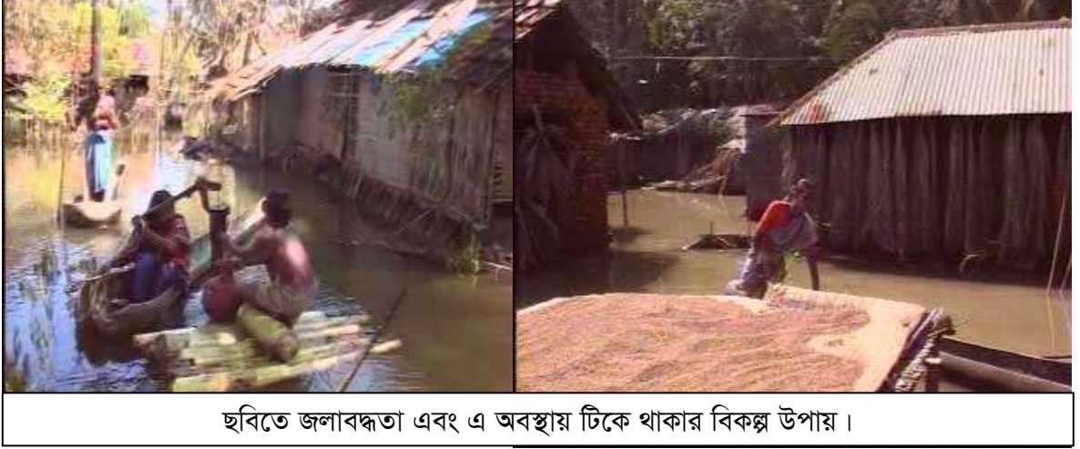
ছবিতে জলাবদ্ধতা এবং এ অবস্থায় টিকে থাকার বিকল্প উপায়।

তাই সকল সুবিধা মেয়েদের তুলনায় ছেলেরা অনেক বেশী পেয়ে থাকে যেমন-শিক্ষা, চিকিৎসা, বিনোদন ইত্যাদি। এলাকার গর্ভবতি মেয়েরা দিনরাত পরিবারের সবচেয়ে কঠিনতম কাজগুলি করে থাকে। যে সমস্ত মেয়েরা নবজাতক কন্যা সম্প্রদানের মা হয়ে থাকেন তারা প্রসূতি মা হিসেবে সেবা পাওয়ার পরিবর্তে পেয়ে থাকেন ধিক্কার, হয়ে থাকেন বিনা দোষে দুষ্টি, শারীরিক ও মানুষিকভাবে নানা কষ্টে থাকতে হয় তাদেরকে।