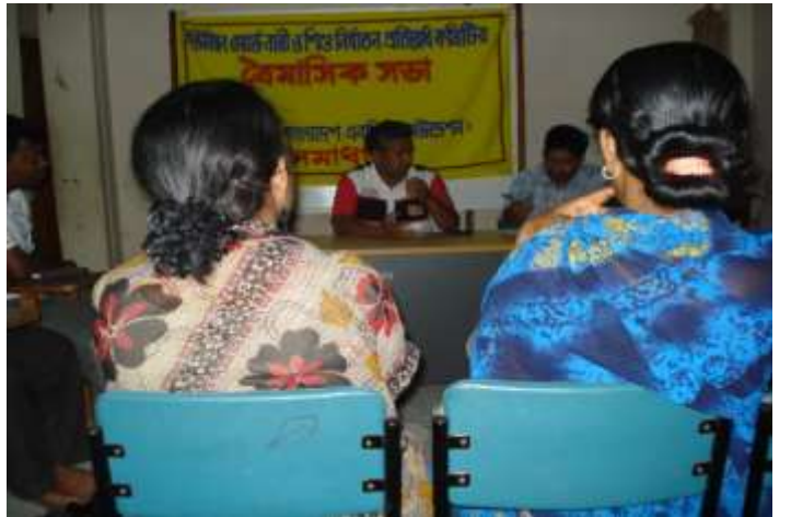
ইউনিয়ন নারী ও শিশু নির্যাতন প্রতিরোধ কমিটির ত্রৈ-মাসিক সভা।

সমাধান-নারী ও শিশু নির্যাতন প্রতিরোধ প্রকল্প সমাপনী প্রতিবেদন'২০