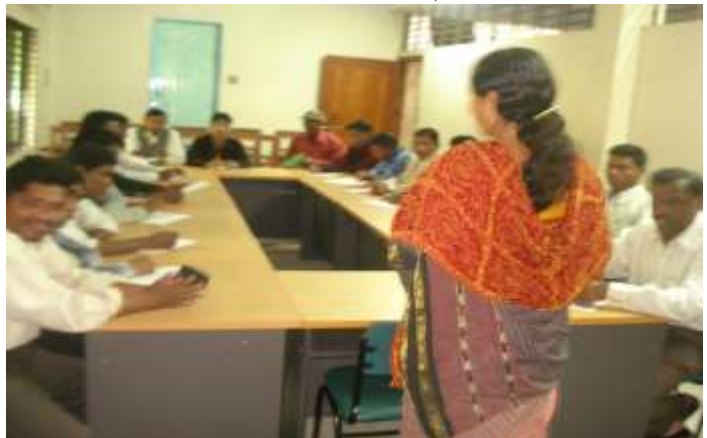
ছবিতে সমাধান এর কর্মী ও কর্মকর্তাদের প্রশিক্ষণ।

প্রকল্পে কর্মী সাপোর্ট তুলনামূলকভাবে কম হওয়ার বিভিন্ন শ্রেণীর ও পেশার মানুষকে প্রকল্পের কাজিত বিষয়গুলি অবহিত করতে অনেক সময় লেগে যায়, অপরদিকে অল্প সময়ে ব্যাপক জনগোষ্ঠীর জ্ঞান সচেতনতা বৃদ্ধিতে বেশী কর্মীর সহায়তার বিকল্প নাই। একটি নির্দিষ্ট এলাকায় একই বর্তা বেশী মানুষের মাধ্যমে প্রদান করলে সাধারণ মানুষের সচেতনতা বৃদ্ধিতে ব্যাপক সারা পাওয়া যায় এবং সময়ে বেশী এলাকা ও মানুষের কভারেজ দেয়া সম্ভব। পাশাপাশি প্রকল্পে বেশী কর্মী নিয়োগের সুযোগ থাকলেও নতুন নতুন কর্মীদের প্রশিক্ষণ দিয়ে কার্যক্রম বাস্তবায়ন উপযোগী করতে বেশ একটা সময় নষ্ট হয়, তাই প্রশিক্ষিত ও অভিজ্ঞ কর্মীকে শুধুমাত্র ওরিয়েন্টেশন দিয়ে সল্প সময়ে কাজে লাগানো যায়, যেহেতু এলাকার সবকিছু আগে থেকেই তাদের জানা আছে। তাই সংস্থার বর্তমান কর্মীদেরকে ওরিয়েন্টেশন দি